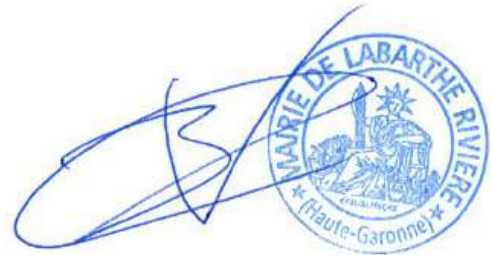
Claire VOUGNY, Maire de Labarthe-Rivière