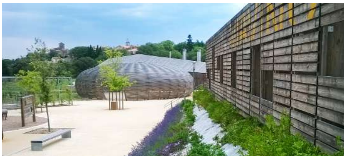
Domaine de Viavino - Commune de Saint Christol (34).

Un bilan de l'action sera dressé en fin d'année 2021, date à laquelle le contrat de filière forêt-bois sera actualisé.